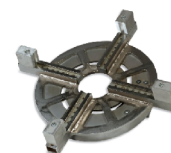
Dispozitiv de sudură capete de flanșă